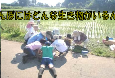
田んぼにはどんな生き物がいるんだろう？