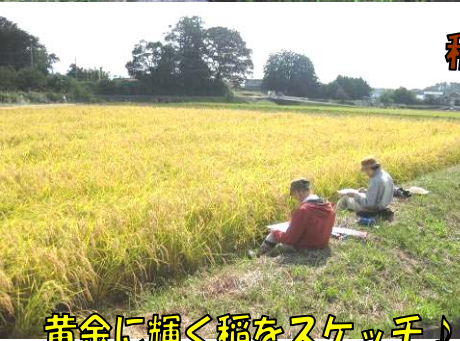
黄金に輝く稲をスケッチ♪