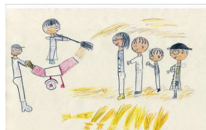
参加組合員さんのお子さんが書いた絵をお米のラベルにしてお届けしました。