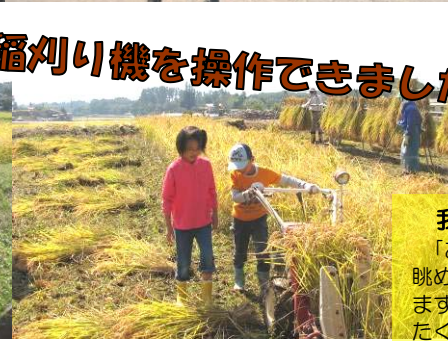
稲刈り機を操作できました！