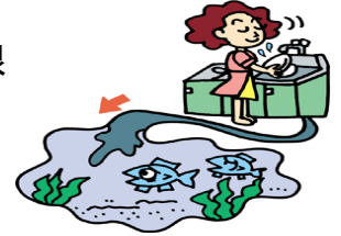
廃食油はリサイクルへ

当会では、スーパーやまと様の協力を得て「廃食油」や「賞味期限切れ天ぷら油」の回収キャラバンを行ないます。