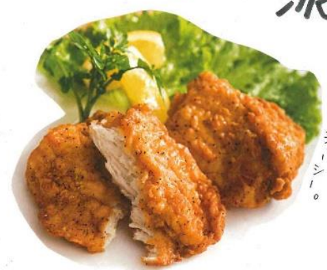
オリジナルスパイシー。